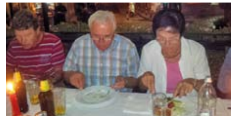
Nachtreffen zu unserer Franzfeld-Reise 2013